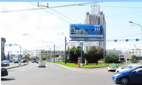
Сторона "А" - видна по ходу движения транспорта