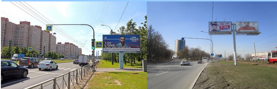
Сторона "А" - видна по ходу движения транспорта